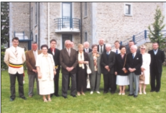
« Les jubilaires en compagnie des autorités communales »

Plusieurs familles particulièrement démunies ont déjà pu bénéficier de vêtements, chaussures et mobilier à titre gracieux.