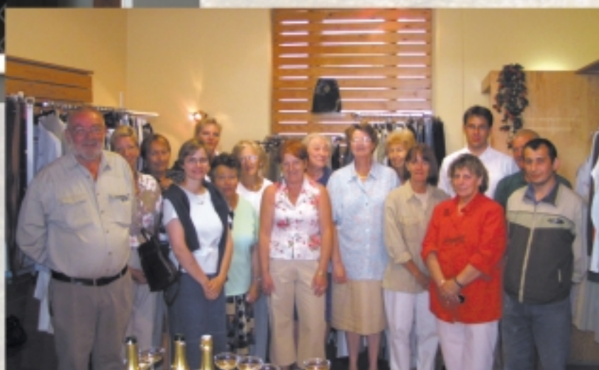
L'équipe qui a permis la mise en place de cet outil - Voir page 9