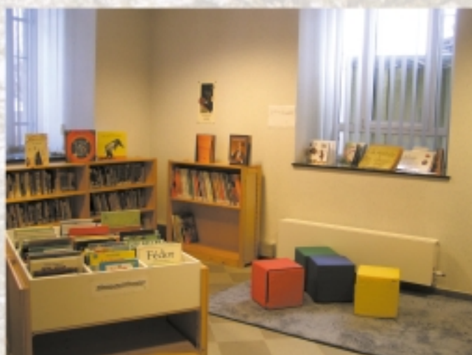
section « jeunesse »