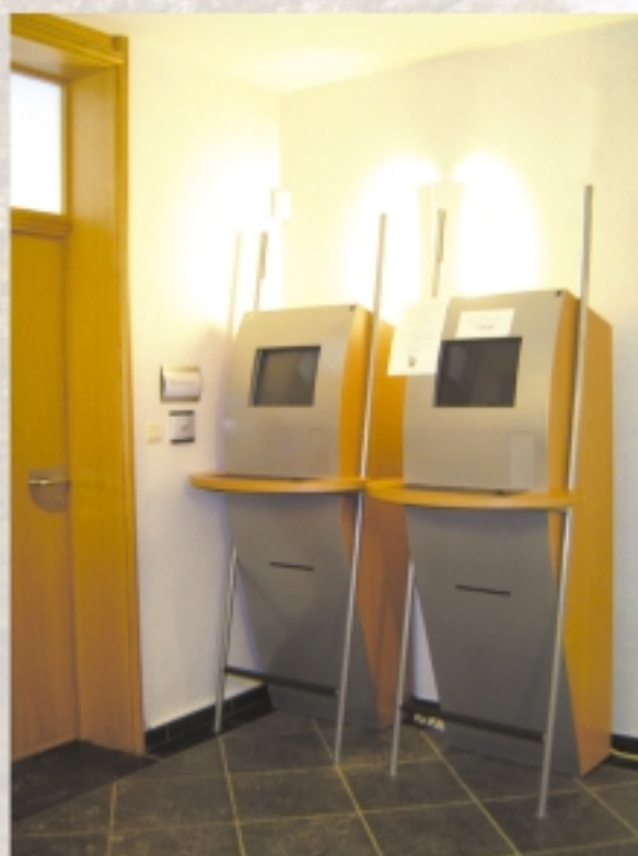
les bornes internet à votre disposition