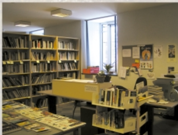
un aperçu de la section « adultes »